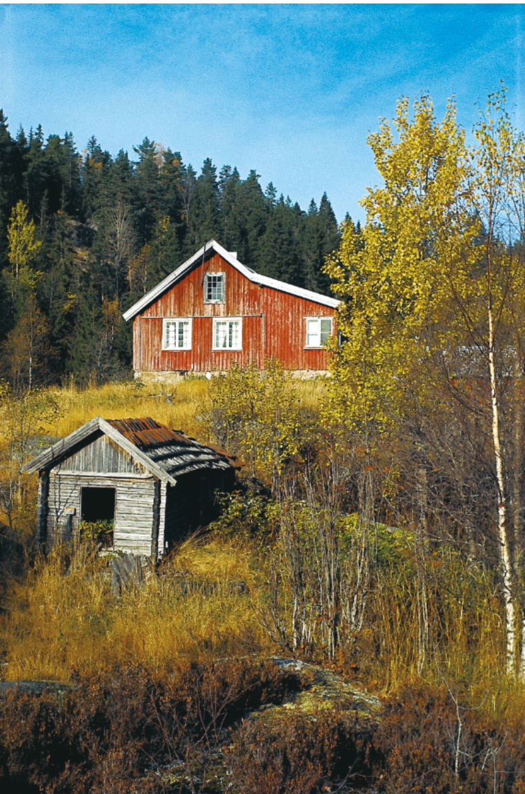
Bøvelstad i oktober 1965. I en årrekke overnattet Sverre M. Fjelstad i det vesle uthuset i forgrunnen. Det var etter at plassen var fraflyttet, og våningshuset (i bakgrunnen) stod folketomt og låst.

Vangen eies i dag av Skiforeningen. Den nåværende skistua er bygget i 1961 og holder åpent nesten hver dag hele året. Vangen var opprinnelig to plasser. Begge stedene var setrer, men ble tidlig på 1800-tallet husmannsplasser under Rausjø bruk 27 .