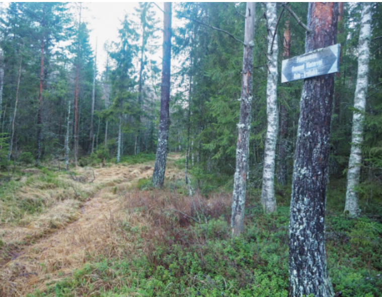
Der Plankeveien gikk i gamle dager, er det nå skiløype på deler av strekningen. Bildet er tatt mellom Skjelbreia og Vangen.