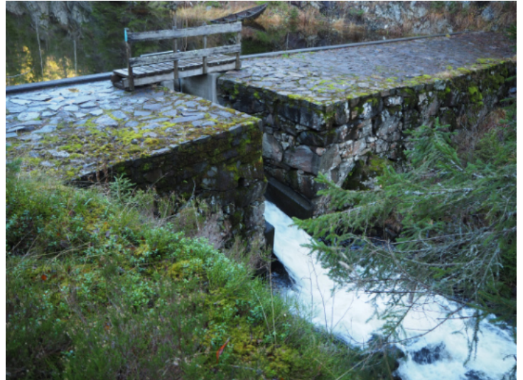
Mosjøen ble antakelig oppdemmet på slutten av 1700-tallet. Slik ser demningen ut i dag.

Kulturminnene etter flere hundre år med setring, hogst og fløting i Østmarka skaper en merverdi for friluftslivet og muligheten for opplevelser, og seterdriften kan til og med ha bidratt til et større artsmangfold. Disse kulturminnene er derfor ikke til skade for