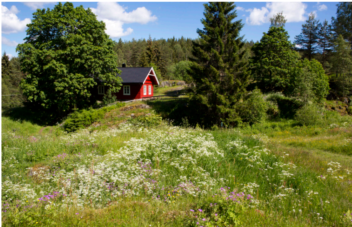
En "gammeldags" blomstereng er et vakkert syn. Her er vi ved Øvresaga, Turistforeningens ubetjente hytte i Rausjøgrenda.

Bruken av utmarksressursene i Østmarka i nyere tid nådde et høydepunkt på slutten av 1800- og tidlig 1900-tall. Et høyt folketall i bygdene rundt Østmarka førte til en intens utnyttning av arealene, før utvandring og urbanisering lettet på befolkningstrykket. Et godt eksempel på dette er den omfattende aktiviteten i Rausjøgrenda, samt seterdrift og beiting i utmarka fra Lørenskog, Rælingen og Enebakksida.