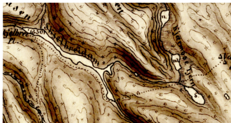
Demningen ved Skjelbreia skapte en stor dam som tømmeret lett kunne fløtes over. (Statens Kartverk, 1877).

Over oppdemte partier ble tømmeret fløtet uten problemer, og i de korte bekkestrekningene mellom dammene gikk det forholdsvis greit når man slapp nok med vann i bekkene. I bekken fra Svartoren til Bindingsvann var det imidlertid vanskelig fløting, så her ble det anlagt flere tømmerrenner. På denne strekningen finnes det rester etter Torerdammen, en tømmerkistedam som var ca. to meter høy og ble oppkalt etter en fløtebas som omkom under fløting i juni 1865 26 .