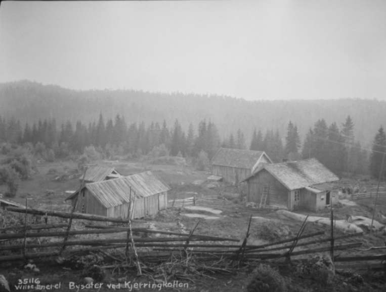
Slik så Bysetra ut i 1929, nå er den en velholdt speiderhytte.

Bysetra var opprinnelig seter under By gård på Flateby (Enebakk). Stedet ble senere husmannsplass under Rausjø bruk. Huset som nå står på Bysetra ble bygd ca. 1840 og skal ha vært det første bolighuset i Rausjø med tre rom 37 . Setra eies nå av Oslo Kommune, og Bølerspeiderne disponerer den.