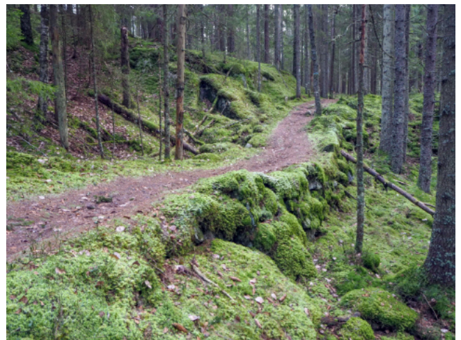
Dette kan være en av Cudronas gamle ridestier, som senere er blitt oppgradert til kjerrevei.

Ved Cudrios stein eller på Cudrioberget overrakte Peder og Karen Cudrio personlig lønningsposen til fullmektigen fra Losby bruk. Cudrios stein er fortsatt der – vest for nordenden av Svartkulp 16 .