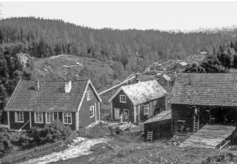
Rausjøgrenda ca. 1910. I bakgrunnen ser vi tømmerrenna nedover mot Børtervann.