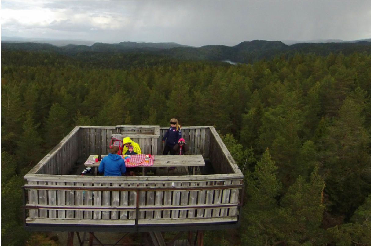
Med barna på overnattingstur i branntårnet på Kjerringhøgda, eller Kjerringkollen som det het i gamle dager. Utsikt over nasjonalparken mot Tonekollen.

Svartoren er et vann som ble dannet ved oppdemningen av en bekk på 1800-tallet, for å underlette fløtingen ned mot Bindingsvann. Omtrent midtveis i det nesten tre kilometer lange vannet treffer du på den originale trekkflåten som pensjonistdugnadsgjengen ØX står bak. Flåten, som nå har blitt en del av det blåmerkede stinettet i Østmarka, gjør at turfolket kan trekke seg over det få meter smale vannet. Den første demningen i Svartoren var ikke like høy som den nåværende, og lå litt annerledes.