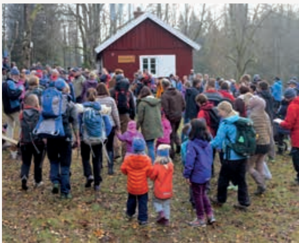
Fra åpningen av Dølerud.