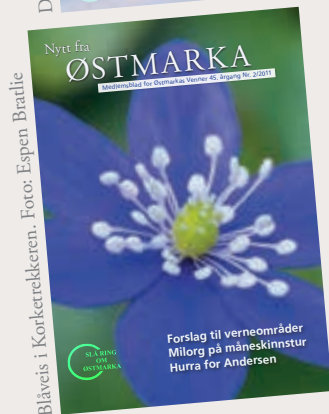
Blåveis i Korketrekken.