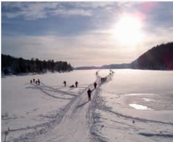
Vinterdag på Elvåga.

Det finnes en rekke serveringssteder i Østmarka. De største er Sandbakken, Skullerudstua, Rustadsaga og Mariholtet, alle i Oslo, Losby gårds kafé i Lørenskog og Vangen i Enebakk. I tillegg finnes flere mindre serveringssteder med mer begrensete åpningstider. For dem som ikke nøyer seg med en dagstur, er det muligheter for overnatting på Vangen og på DNT Oslo og Omegn ubetjente hytter: Røyri-vannskoia, Øvresaga i Rausjøgrenda, Bøvelstad ved Støttumfjorden. Både Dølerud og Bøvelstad er tidligere husmannsplasser som er restaurert av DNT med bistand fra ØVs medlemmer. Begge er blitt flotte turmål i Østmarkas vakreste omgivelser.