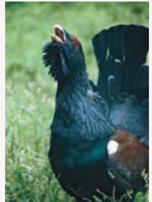
Tiuven vokter Østmarka.

I hjertet av Østmarka finner vi det største inngrepsfrie området i denne delen av landet. Det er økende press på Østmarka, og en voksende befolkning i Oslo-regionen trenger en nasjonalpark hvor de kan oppleve natur og dyreliv. Derfor må vi beskytte deler av Østmarka, slik at også våre barnebarn kan få anledning til å oppleve dette enestående skogslandskapet.