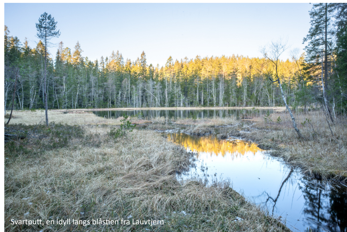
Svartputt, en idyll langs blåstien fra Lauvtjern