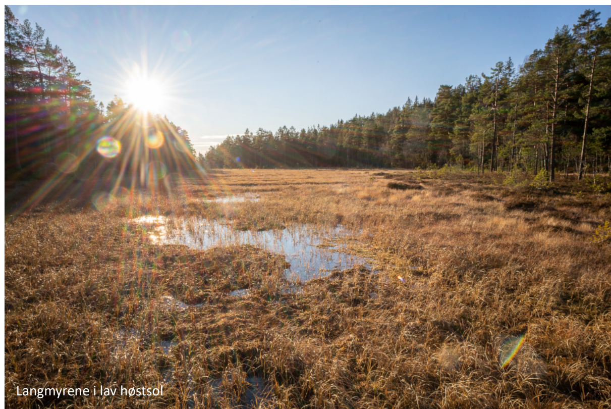
Langmyrene i lav høstsol