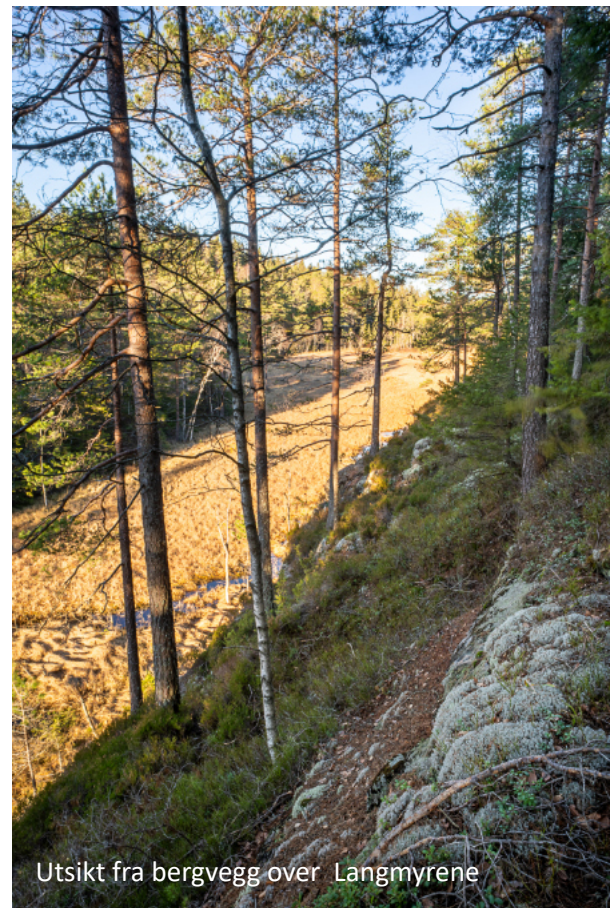
Utsikt fra bergvegg over Langmyrene

Ellingsrudlia er en østvendt og viktig naturtype med gammel granskog (75 daa) med en god del furu i bratte skråninger og på tørrere og fattige partier. Det er spredt med osp, rogn, selje og bjørk i hele skråninga. Skråninga er til dels meget bratt og utilgjengelig med rekke bergvegger og rasmark/ur. Skogen er flersjiktet med mye liggende død ved i alle nedbrytningsstadier. Vegetasjonen er variert med blåbærskog, lågurtskog og bærlyng/lavfuruskog. Av rødlistearter er det to funn av granrustkjuke, ett funn av svartsonekjuke og ett funn av grønnsko.