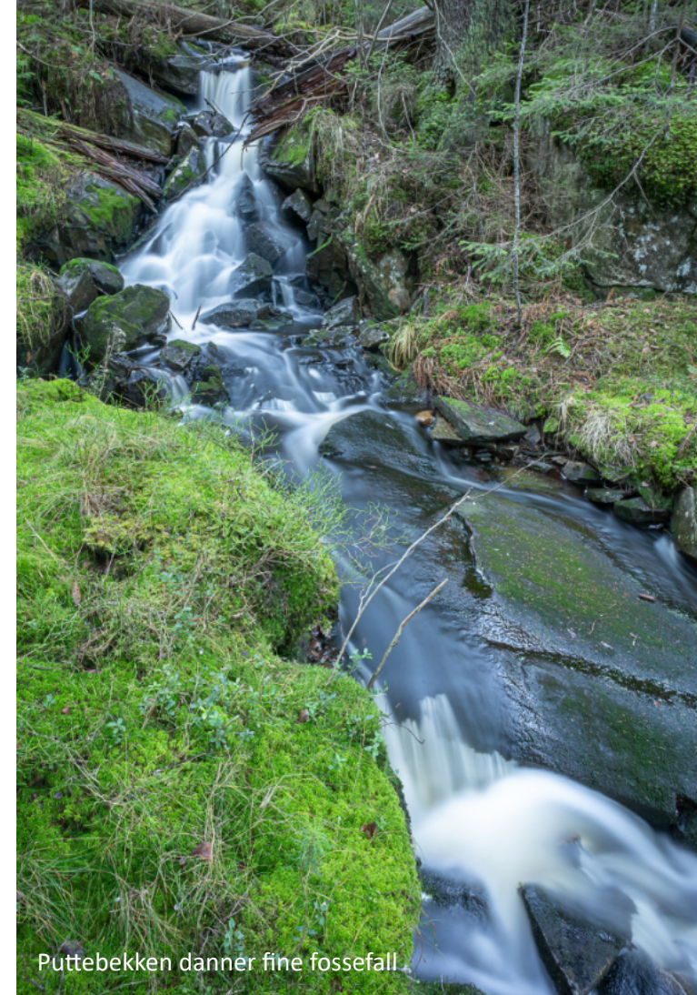
Puttebekken danner fine fossefall

Området er preget av godt beitet furu og rogn, og spor og tegn ses tydelig etter elg, rådyr og hare. Det er observert flere spettearter og mindre rovfugler i området.