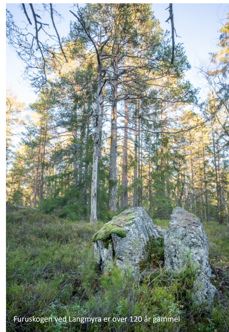
Furuskogen ved Langmyra er over 120 år gammel