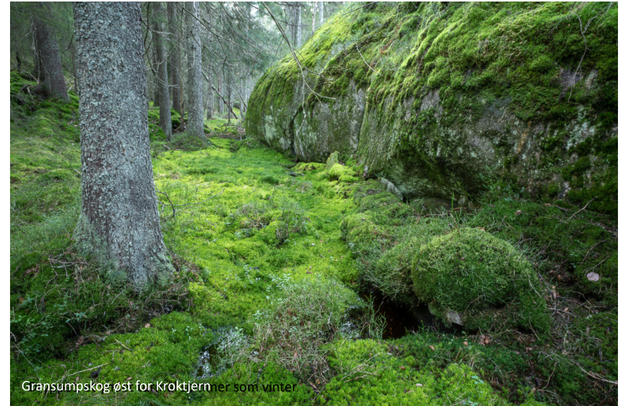
Gransumpskog øst for Kroktjern nær som vinter