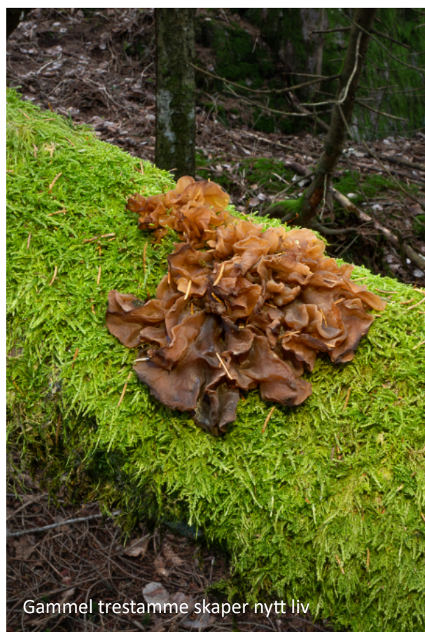
Gammel trestamme skaper nytt liv

Dette er et av Østmarkas høyestliggende områder med åser på godt over 300 moh. Flere mindre nord-sørgående forkastninger danner små sprekedaler og bergvegger og sørger for variasjon og kompleksitet i landskapet. Området er opplevelsesrikt og variert med koller og åser, skrenter og steinblokker samt flyttblokker som er spennende for turgåere.