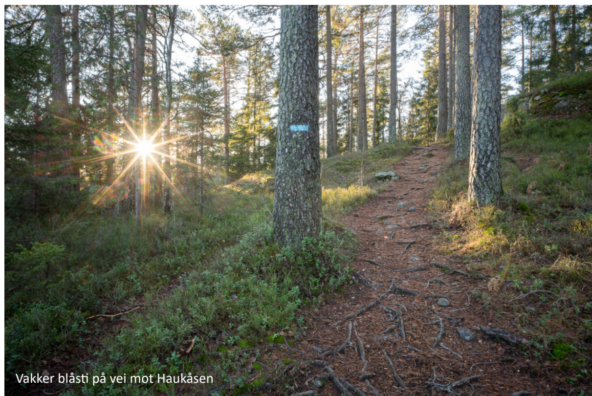
Vakker blåsti på vei mot Haukåsen