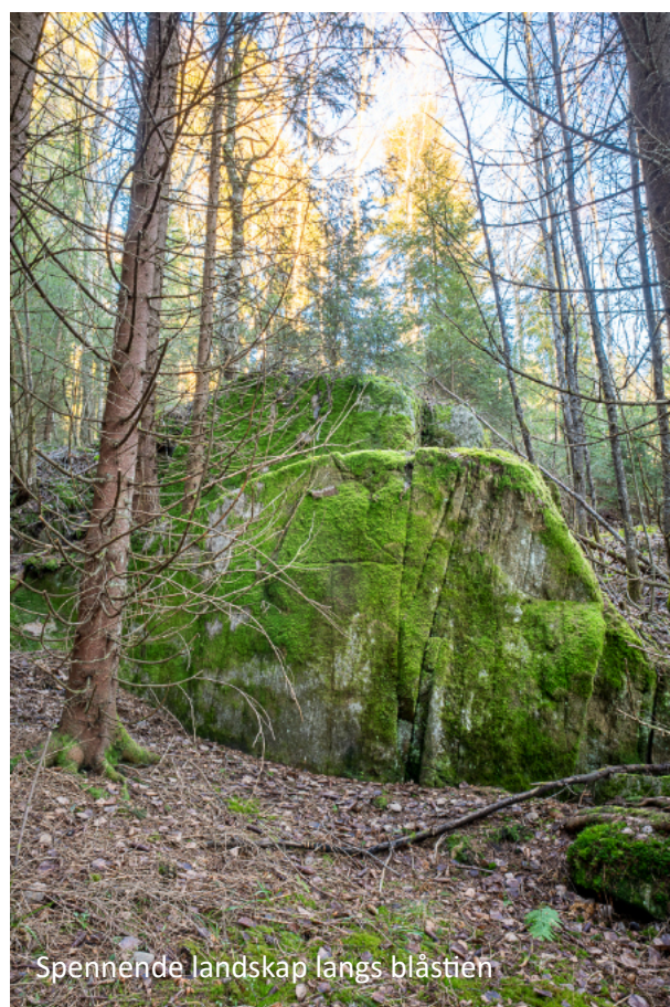
Spennende landskap langs blåstien

Langs ryggen fra «Djevelens prekestol» og øst for Langmyrene går det et tråkk uten slitasje, da området er mindre besøkt. Området er preget av stillhet og ro, og er veldig opplevelsesrikt.