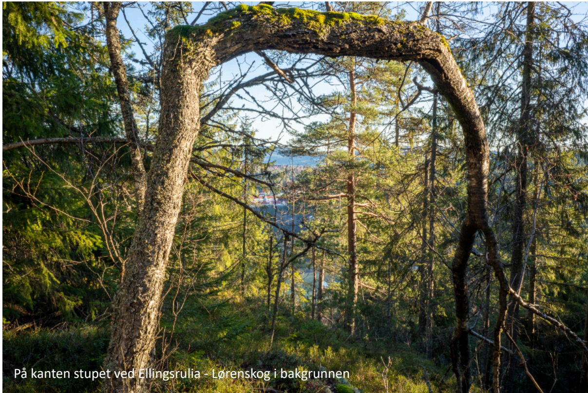
På kanten stupet ved Ellingsrudlia - Lørenskog i bakgrunnen