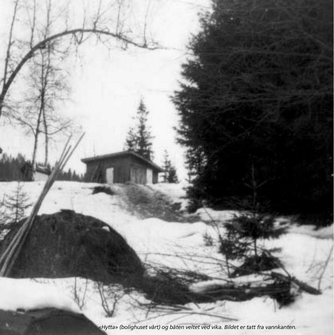
«Hytta» (bolighuset vårt) og båten veltet ved vika. Bildet er tatt fra vannkanten.