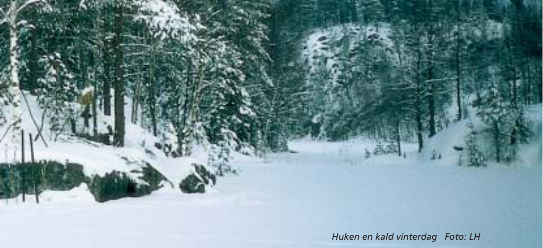
Huken en kald vinterdag

var ikke bare en rasteplass, men et kjært turmål, spesielt om vinteren, med beilelig beliggenhet like ved en av hovedløypene gjennom Østmarka. Dog ikke slik å forstå at folk strømmet til i horder. Faktisk kunne man sitte her i timevis uten å bli observert. Hukens lille gjestebok ble flittig benyttet av folk fra nær og fjern – også de som bare stakk bortom og spiste matpakka på treningstur.