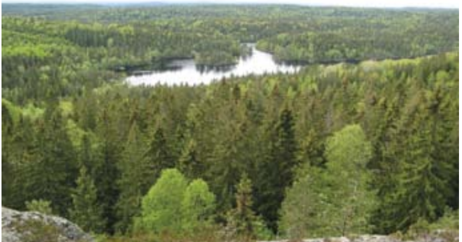
Utsikt fra Tonekollen og over Tonevann og store deler av det det foreslåtte området med Skogsmåsan og Paradisåsen i det fjerne.

I Stortingsproposisjon 1 S (2009–2010) fra Miljøverndepartementet, er INON (inngrepsfrie naturområder i Norge) et eget arbeidsmål som går ut på å «sikre at attværande naturområde med urørt preg blir tekne vare på».