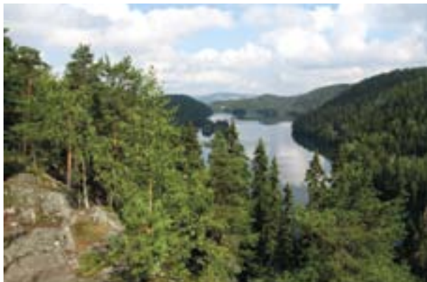
Utsikt over Lutvann.

Området har et uberørt preg og det er flere delområder med gammelskog/bevaringsskog som er «fredet» i Flerbruksplanen for Oslos kommuneskoger. Området blir mye brukt av befolkningen og er av den grunn også verneområde for friluftsliv i Flerbruksplanen. Området ligger i kort avstand fra bebyggelsen som strekker seg fra Lindeberg, Trosterud og Haugerud i nord via Oppsal til Bøler i syd. De mest brukte innfallsporene er Østmarksetra og Lutvann leir. Området er på ca 1900 da.