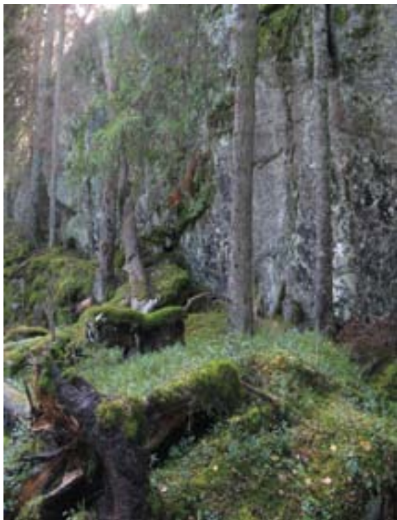
Dråget mot Spinneren.

Området har et stort mangfold av naturtyper og inneholder viktige viltlokalteter. Området er et særlig viktig friluftsområde som brukes svært mye av befolkningen, i all hovedsak for fotturer vår, sommer og høst. Området er derfor administrativt fredet av Oslo kommune. Området ligger mellom Østmarkskapellet i nord og Sandbakken i sørøst og i relativt kort avstand fra utfartsparkerene ved Grønmo og Sandbakken. Området er ca 1900 da stort.