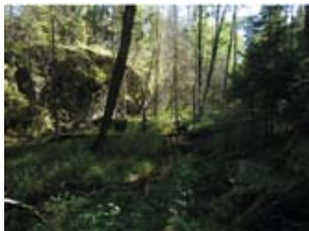
Sølvdoblabekken mot sør.

Den idylliske plassen Dølerud ligger midt i området. Den kan restaureres og eventuelt