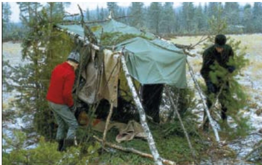
Far og sønn ved gapahuk på tiurleik.