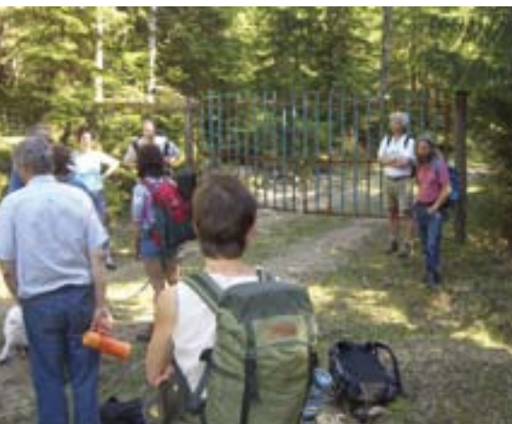
På tur langs Flyktingeruta ble våre medlemmer møtt av denne låste porten ved Fudalen.

Det viktige med den nye friluftsløven er at kommunene eller departementet nå har hjemmel til å gjennomføre enkle tiltak for å lette ferdselen i utmark og å ilagge tvangsmulkt dersom ikke stengsler eller skilt til hinder for lovlig ferdsel fjernes. I tilfellet Ekebergdalen i Enebakk er det mulig å legge en tursti mellom de to eiendommene uten større sjenanse for noen av gårdene, men ikke engang dette alternativet har man til nå greid å bli enige om. Østmarkas Venner krever nå at saken løses juridisk, om nødvendig ved å ilagge tvangsmulkt.