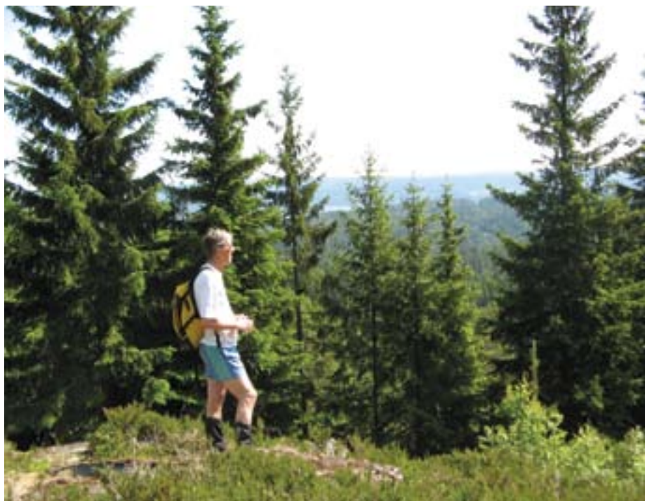
Utsikt fra Knatten sør Hengeberget sørøst.

Området er ca 3600 da. Området er ikke befart, og grensene kan derfor trenge justering.