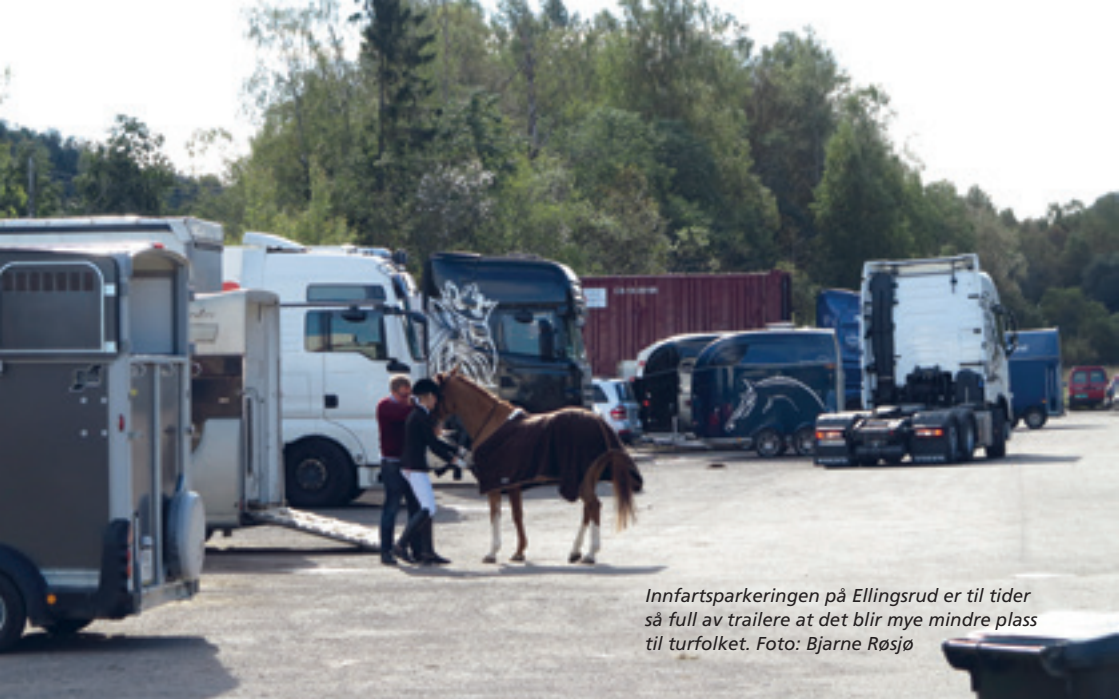
Innfartsparkeringen på Ellingsrud er til tider så full av trailere at det blir mye mindre plass til turfolkene.