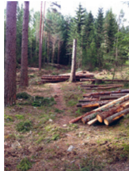
ØV reagerer skarpt på hogsten i «hundremeterskogen» ved Søndre Dal. «Hundremeterskog» er en betegnelse på små idylliske friområder, gjerne mye brukt av barn.

ØV-styret tok umiddelbart kontakt med skogetaten med krav om en befarings, for å diskutere berettigelsen av hogsten og om mulig få den stoppet. Det viste seg at det var snakk om en forskriftsmessig innmeldt tynningshogst utført av Skogavdelingen i