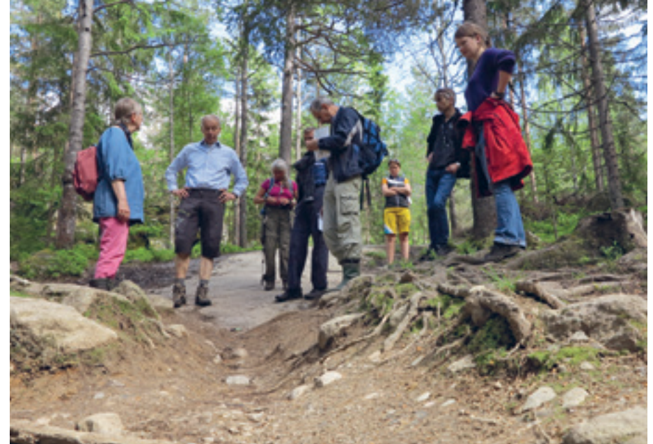
Oslo og Omland Friluftsråd har nedsatt en arbeidsgruppe som vurderer sykling i Marka. Her er arbeidsgruppa på befarig innenfor Skullerudstua, for å se på skader etter terrensykling.

reagert på at syklistene legger nye og visuelt skjemmende klopper rett over eksisterende klopper som var helt utmerket for fotgjengere, men som ikke passet syklistene fordi bordene var smale og var lagt i lengderetningen.