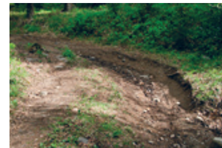
Hjulspor etter traktor eller ATV? Nei her har det gått et sykkelritt.

Opplevelse av stillhet og fravær av det som omgir oss til daglig i vår urbane hverdag er et stort behov for mange. Friluftsliv må baseres på ferdsel til fots og på ski uten bruk av tekniske innretninger.