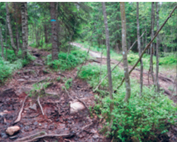
En gang en idyllisk sti over Gardfangåsen.

Jeg er glad for at synspunkter om måten marka brukes på kommer tydelig frem. Beskrivelsen av de smale stienes betydning for naturopplevelsen og omtalen av problemene med terrengsykling var gode. Jeg er helt skremt av hvordan næringsinteresser fyrer opp under bruken av naturen som arena. Trolig burde terrengsykling kommet inn i samme lov som motorisert ferdsel i naturen. Det er ikke bare motorstøy som sjenerer. Det burde vært forbud mot alle slags tekniske hjelpemidler til bruk i naturen for fritidsaktiviteter. Jeg har prøvd å uttrykke noen synspunkter på denne