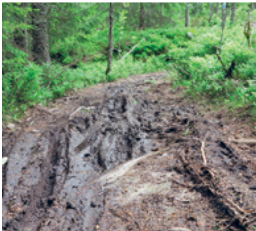
Som om noen har kjørt med jordfreser over stien.

Det er også viktig at framtidige avgjørelser som i praksis får irreversible konsekvenser