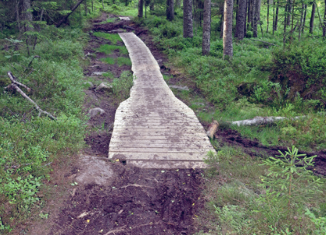
Flere terrengsykklister mener at kloppingen «kommer alle til gode», men mange turgåere opplever at slike store anlegg ødelegger naturopplevelsen. Bildet er tatt på strekningen mellom Nordre Skytten og Skråbakkhullet, uka etter Østmarkrittet 30. juni i år.

behov. Faktum er at en god del av oss ønsker opplevelser av å ferdes i ekte og i mange tilfeller bortimot urørt natur. Karakteren til stien man går på, er svært viktig i denne sammenhengen, og ikke som en del sykklister synes å mene – nemlig at stien og naturen rundt er to adskilte ting. Forsøk for eksempel å erstatte stien på Spinnern med stien østover fra Vannverket. En tur på Spinnern ville da blitt en mye mindre sjarmerende opplevelse, selv om naturen rundt ville ha vært den samme. Utstrakt klopping av stiene bidrar i betydelig grad til forringelse av naturopplevelser.