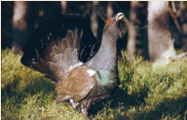
Tiur i hjertet av Østmarka.

Mandag 11. november kl. 19.00 på Skullerudstua