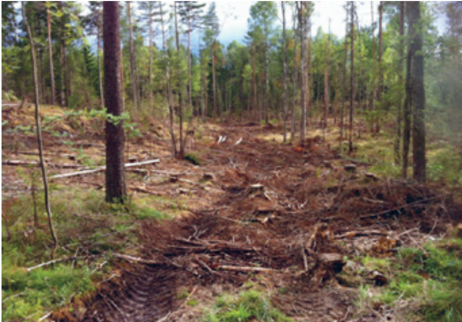
Eksempel på hogst og hjulspor i hundremeterskogen ved Søndre Dal.

Det er da merkelig at Oslo kommune skal vandalisere nærområdene i Østmarka (ca. 200 meter i luftlinje fra bebyggelsen), når de har så store områder å forsyne seg med tømmer av. Og, om det likevel skulle være så dårlig stelt at de trenger disse kronene: Hva med den verdien skogen hadde som