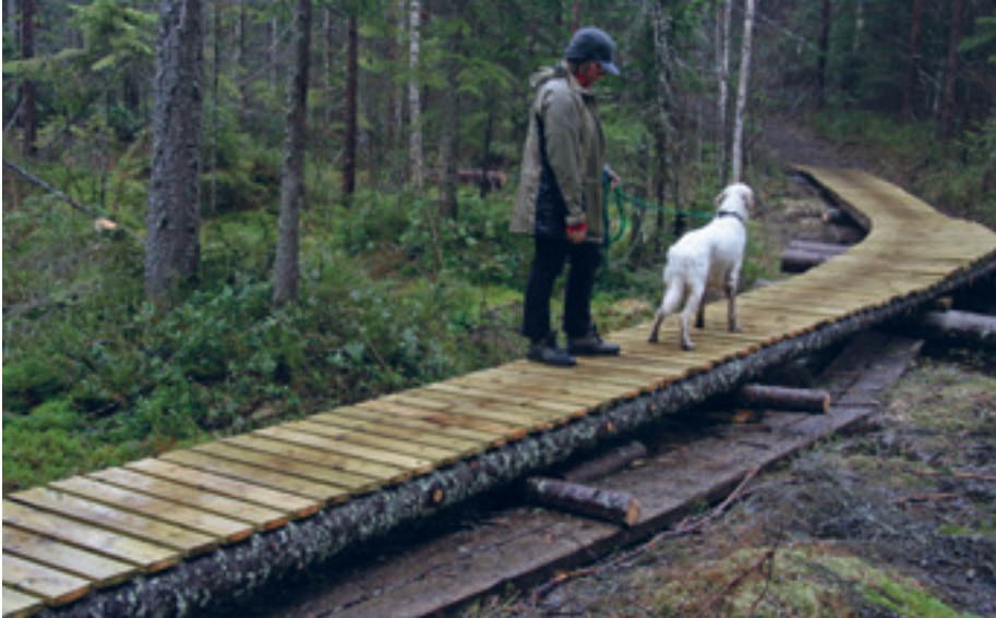
Oslo kommune og arrangørene fraktet nesten fem tonn materialer inn i Østmarka før Terrensykkelrittet 2013. Materialene ble blant annet brukt til å legge en ny sykkelklopp ovenpå en av ØX sine klopper som var helt utmerket fra et vandrersynspunkt.