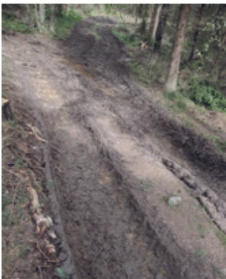
Kjøreskader ved Søndre Dal.

rekreasjonsområde for innbyggerne i området? Det har de elegant oversett.