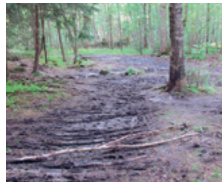
Sti ved Haraløkkå etter sykkelritt i mai.

Det er nødvendig å begrense bruk av tekniske hjelpemidler for friluftsliv til enkelte