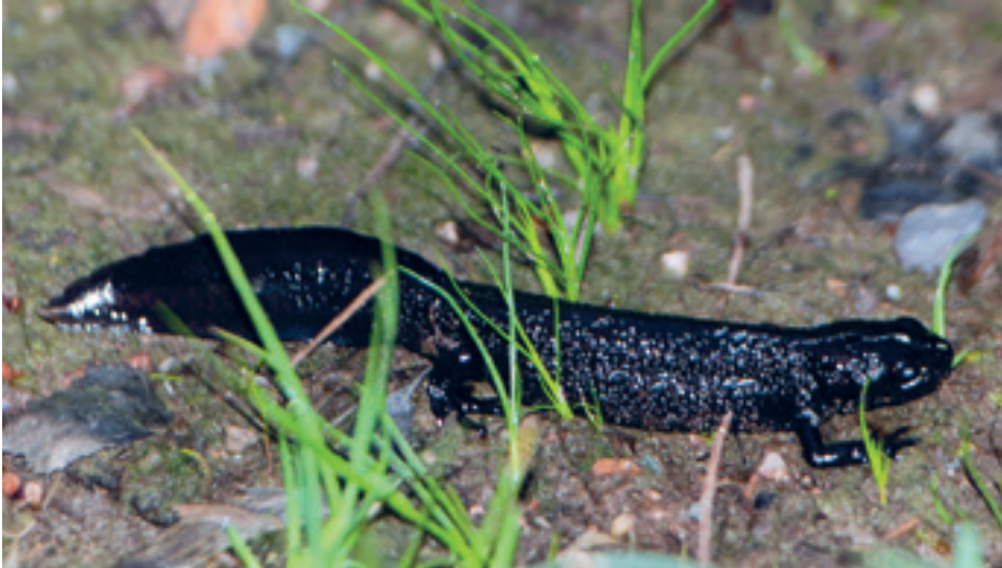
Storsalamander er en av artene du kan finne ved Fjellstaddammen, hvis du bruker øynene.

gjorde han også en mørk og varm augustkveld i fjor, som alltid med kameraet klart og sansene skjerpet. Turen gikk innover på skogsveien fra Skullerudstua, og etter noen hundre meters vandring kom Haugen til bunnen av Fjellstadbakken. Her var det slåmbakke fra 1972 til 1990, men det eneste som nå er igjen er en nedslitt varmetue, og en kunstig anlagt dam som visstnok skulle skaffe vann til snøkanonene. Dammen har ikke noe offisielt navn, men la oss kalle den for Fjellstaddammen.