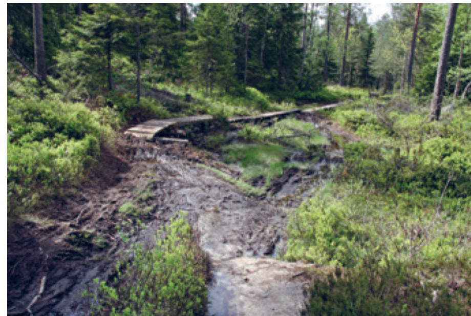
Østmarkrittets trase forbi Slettfjell: Her har mange syklistere under trening brutt NOTS' stivettregel nr 8: «Bær sykkelene gjennom myrområder slik at det ikke dannes dype spor». Bildet er tatt to uker før selve rittet.

Østmarkrittet 2013 gikk av stabelen 30. juni, og med over 1000 deltakere var dette rittet enda større enn Terrengsykkelrittet. Østmarkrittet hadde start- og målområde i Rådhusparken ved Metro senteret på Lørenskog, og deltakerne tilbakela opptil 55 km gjennom «de nærmest uberørte skogsområdene i Lørenskog og over til de mer kjente områdene innenfor Oslos grenser», for å bruke arrangørens egne ord. Deltakerne passerte Losby Gods og syklet videre sørover forbi Drettvann via Stokkholtmyra, over Kavlebrumyra, 17. mai plassen, Skråbakkhullet mot Elvåga og Skyttenbrua, før de satte kurs-