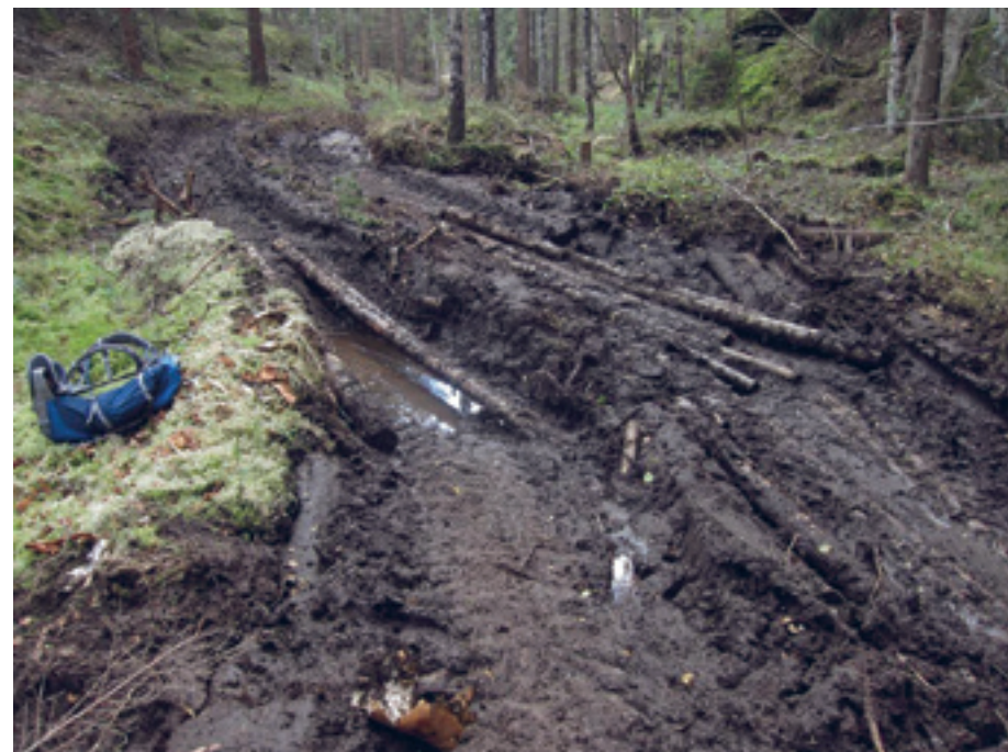
Slik ser det ut etter sommerens hogst som har foregått fra Skyttenbrua og sydover på vestsiden av Sør-Elvåga.

Så om noen tror at presset på Østmarkas innhold er blitt mindre etter innføring av markaloven, må de dessverre tro om igjen. En ting er at vi må bedrive voksenopplæring for å få de ansvarlige til å følge det vedtatte lovverket, en annen ting er at presset på Østmarkas innhold øker stadig vekk i omfang og fra uventet hold. Så her må vi nok fortsatt stå på og kanskje bli tøffere i klypa.