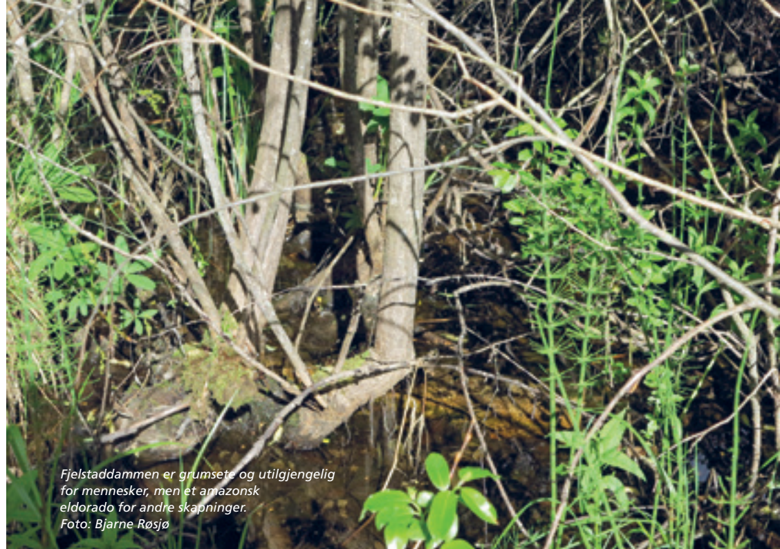
Fjelstaddammen er grumsete og utilgjengelig for mennesker, men et amazonsk eldorado for andre skapninger.