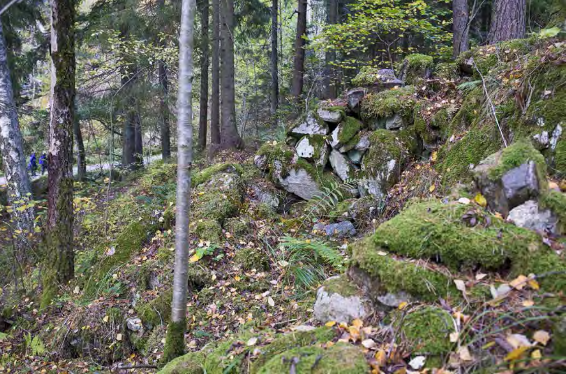
Ruinen etter Smedhytta. Mennesker på dagens vei i bakgrunnen.