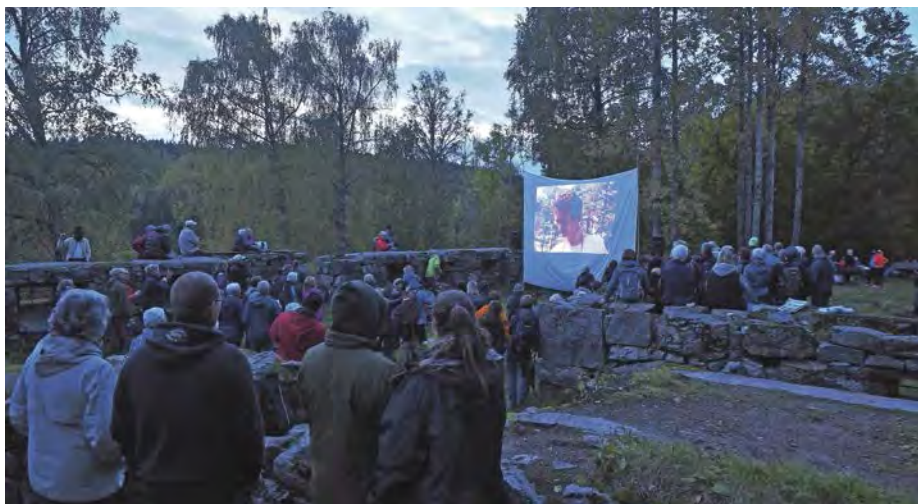
I ruinene på Sarabråten ble det vist gamle filmer fra Østmarka – et populært innslag i høstkvelden.

Vel framme ved Sarabråten bød arrangørene på kaffe, saft og julekake, og mange hadde fulgt oppfordringen om å ha med seg mat for grilling. De frammøtte fikk også en smakebit fra det historiske musikkspillet «Spillet om Sarabråten» som skal settes opp neste høst. Kortfilmen «Østmarka – byen bak blokkene» fra 1977 ble også vist på storskjerm.