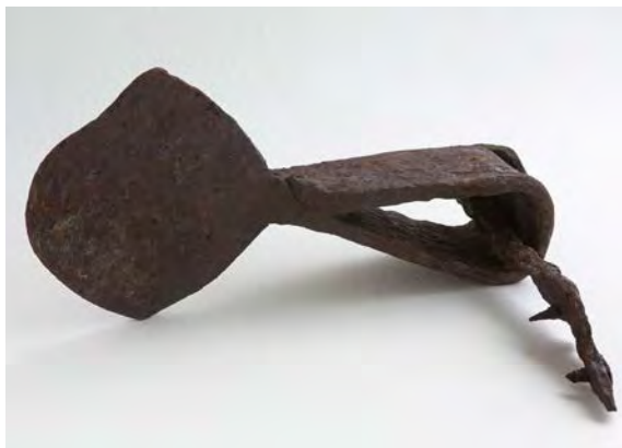
Jordhakke: Et overraskende funn i ruinene etter Smedhytta.