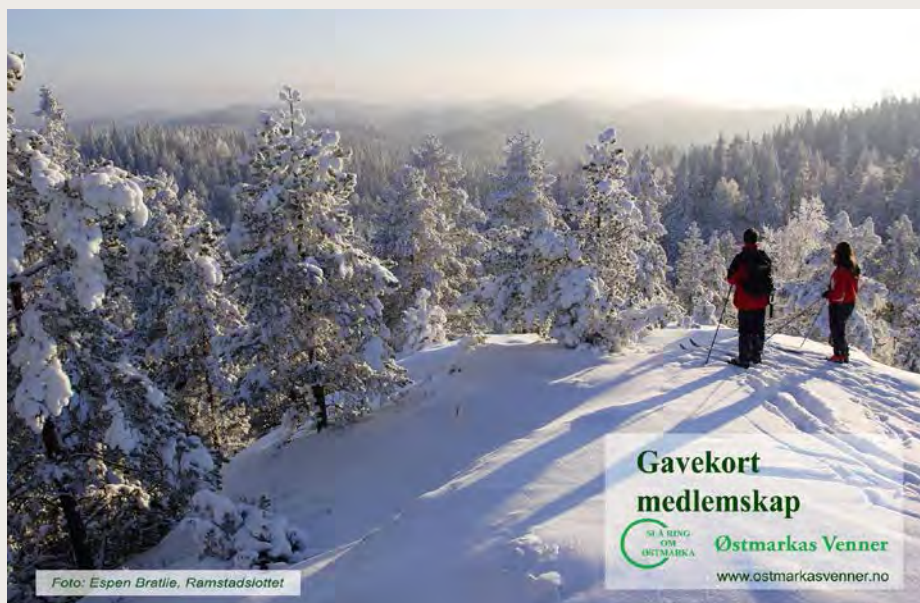
Ramstadslottet

Eventuelle spørsmål om gavemedlemskap rettes til medlem@ostmarkasvenner.no eller mobil 949 82 006.