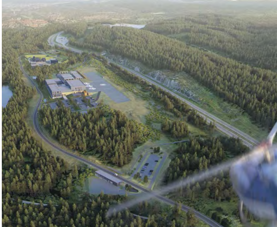
Østmarkas Venner frykter at helikoptertrafikken fra Taraldrud vil forringe friluftslivet og naturopplevelsene i både Østmarka og Sørmarka. Illustrasjon: Justis- og beredskapsdepartementet.

flyaktiviteten over Østmarka med mange flygninger fra flyplassen på Kjeller, ofte i helgene. Ved etablering av Oslo helikopter-plass på Taraldrud økes belastningen ytterligere over hele Østmarka, og i tillegg blir Sørmarka sterkt berørt.