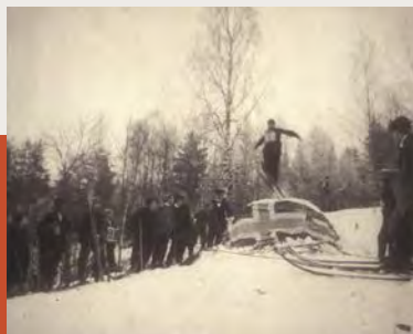
Østensjø lokalhistoriske bilder

Alle er hjertelig velkommen. Påmelding ikke nødvendig. Arrangementet går uansett værforhold.