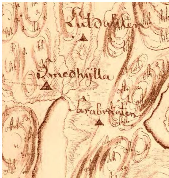
Kart over Sarabråten med omegn. 1796, utsnitt. Original i Statens Kartverk. Smedhytta er tegnet inn på den andre siden av Rundtjernbekken, men der er det veldig ulendt med digre steiner og en bratt fjellskrent. Det var naturlig at smeden holdt til ved en ferdsselsvei og nært til vann.