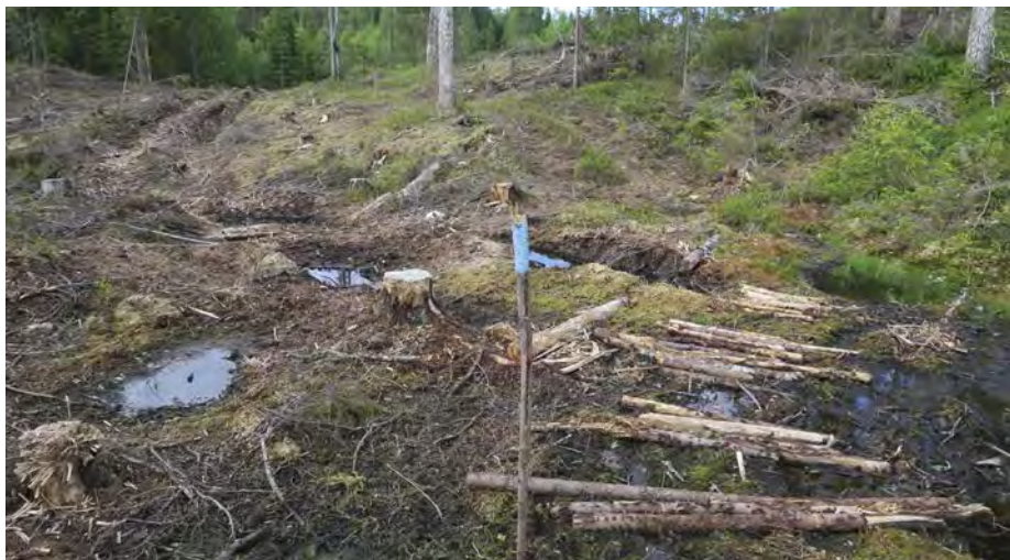
ØV har kritisert at forslaget til ny markaforskrift er skrevet altfor mye på skogbrukets premisser, mens friluftslivet og naturvernet stiller bakerst i køen.

annet pekte på at forskriften må forankres både i markaloven og i skogbruksloven – ikke bare i skogbruksloven, som forslaget går ut på.