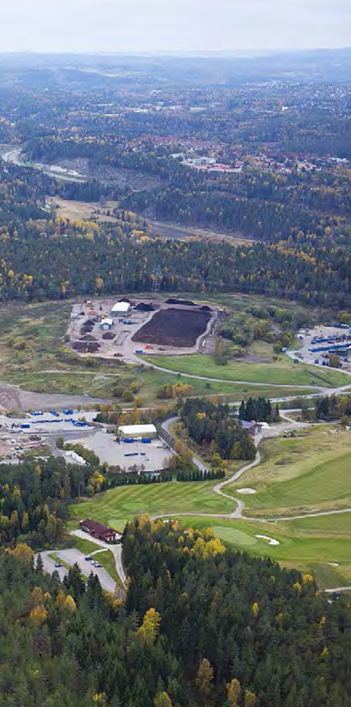
Den tidligere søppelfyllingen på Grønmo kan bli de sørøstlige bydelenes svar på Frognerparken og være tilgjengelig for folk flest, mener Østmarkas Venner.

Grønmo i Østmarka ble tatt i bruk som hoveddeponi for Oslo kommune i 1969, men er nå nedlagt og skal omreguleres til ny bruk. Eiendoms- og byfornyelsesetaten (EBY) i Oslo kommune har sendt et forslag til reguleringsplan på høring, og Østmarkas Venner (ØV) skriver i sin høringsuttalelse blant annet at EBY ser ut til å legge opp til en