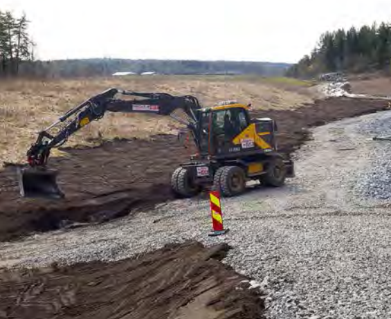
Deponiet på Grønmo er dekket med en membran som fanger opp metangass fra råtnende masser.

seg en cricketbane for familier på området, men dette er dessverre ikke med i planene slik de ser ut i dag, sier Gunnarsdóttir.