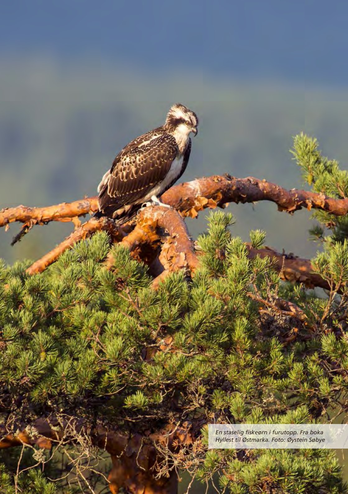
En staselig fiskeørn i furutopp. Fra boka Hyllest til Østmarka. Foto: Øystein Søbye