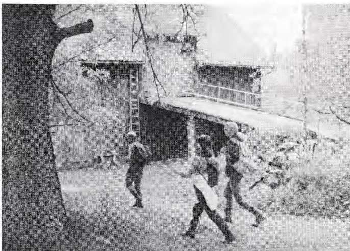
Godlia gård ved den planlagte skytebanen.