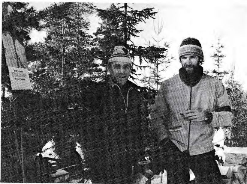
Et lite glimt fra skituren som ble arrangert av Skiforeningen og Østmarkas Venner vinteren 1986.

høring forslag til alternative traseer fra Frogner i Sørums kommunen til Skullerud på Søndre Nordstrand og videre via Follo til Tegneby. Nå var linjen øket til 380 kV, og man forutsatte at den skulle være driftklar i 1982.