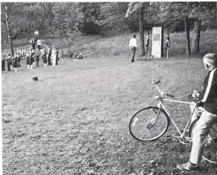
Østmarkas Venner bekranset bautaen på Sarabråten som er satt opp til minne om unge Østmarka-Venner som ofret sitt liv for landet.

Kanskje vi skulle ta oss en tur på Deichman?