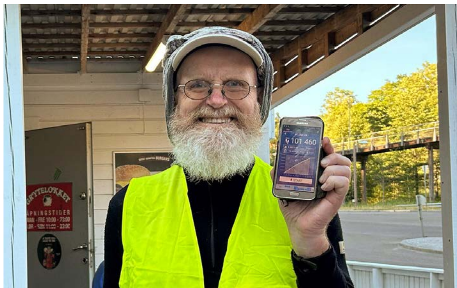
Turen Østmarka rundt endte ved utgangspunktet – Grytelokket – drøye 16 timer etter start. Det var fortsatt noen skritt igjen å gå fram til support-teamets bil.

Du kan lese hele artikkelen på ØVs nettsider, hvor den ble publisert 7. august.