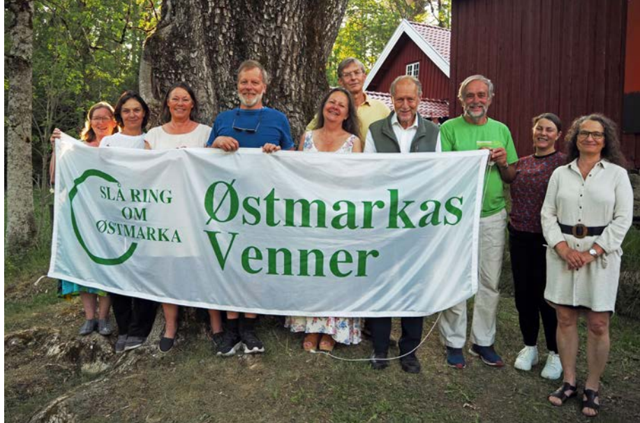
Et nesten komplett styre i Østmarkas Venner, foran tuntreet på Sandbakken.