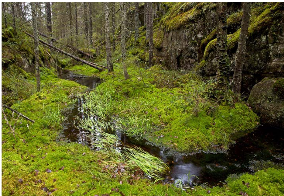
En spe liten bekk på vei mot havet.

allikevel kan vi si at de renner i alle retninger! Og har du tenkt over hvor de havner til slutt? Smalvann, Rundvann og Svartoren er for eksempel begynnelsen på Mossevassdraget, som renner via Langen, Våg og Mjær ned Hobølelva og via Vansjø ut i Mossesundet og Oslofjorden.