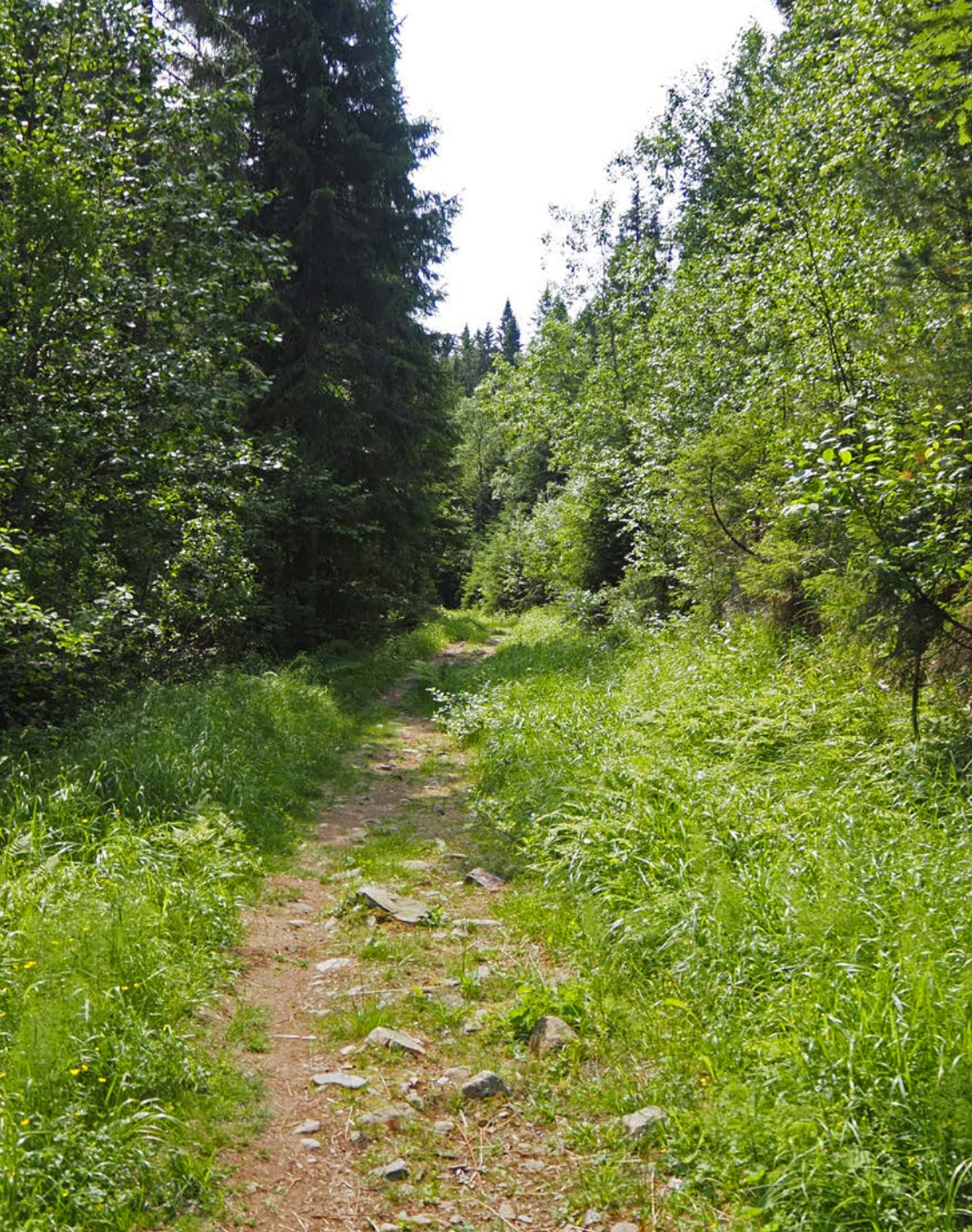
Stien fra Marikollen sørover mot Ramstadsjøen skal bli en bred skogbilvei med inntil 12 meters anleggssone.