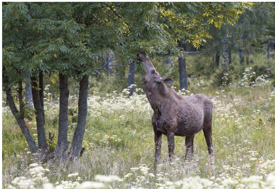
Elgkoll beiter ask på Dølerud. Under varmetiden for over 5000 år siden var ask et mer vanlig treslag i Østmarka.

tur. Grunnlaget for disse ble altså lagt av geologiske prosesser for minst 200 millioner år siden.