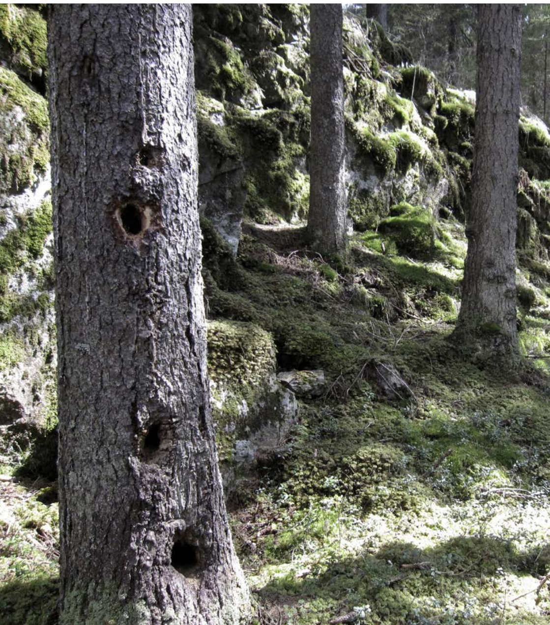
Gammelskogen ved Eriksvann: Verneverdig!