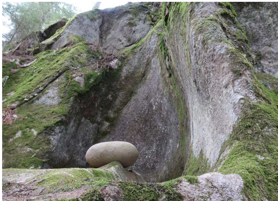
Ved Svartholbekken nord for Bindingsvann kan du finne en stor og en litt mindre jettegyrte.

ning. Stripene er dannet av sand og stein som isen søpte med seg langs bunnen. Så uansett hvor du går i Østmarka, vil du alltid bli minnet om hvordan istidene har formet landskapet og lagt grunnlaget for den naturen vi opplever i Østmarka.