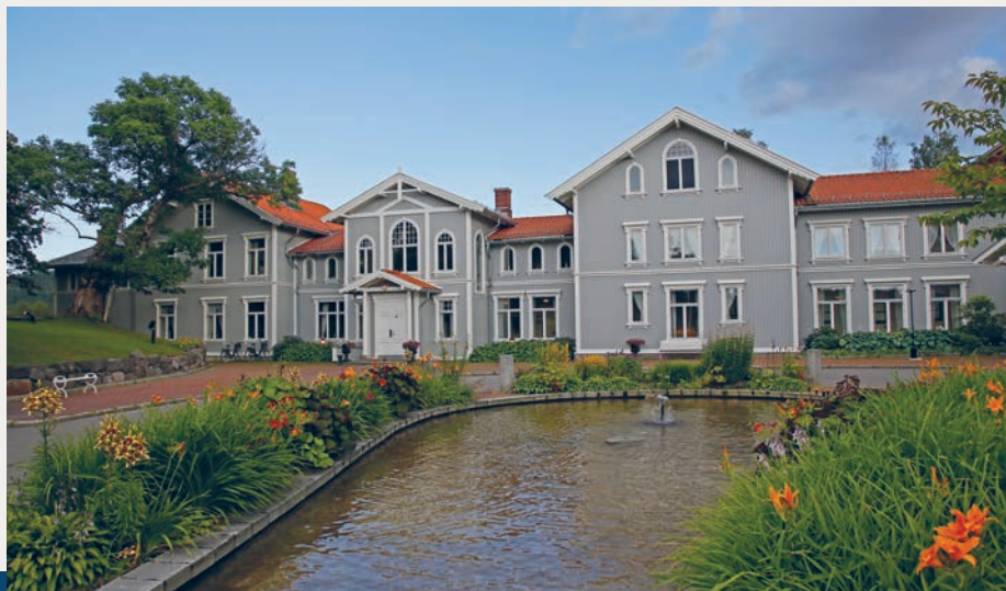
Losby Gods – En reise i tid og tradisjoner.

Omvisningen er gratis, og krever ingen påmelding.