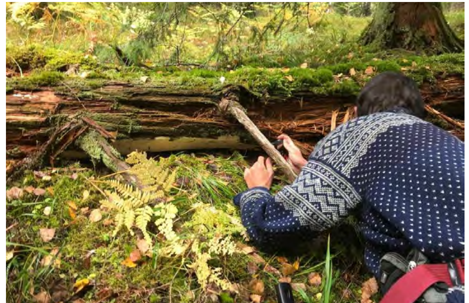
Dynekjuke er en av mange trua arter i skogen i Lørenskog. Her i nærheten av den planlagte Dammyrveien.

ØV minnet om at kommunen utarbeider en kommunedelplan for biologisk mangfold og at det også foreligger en kommunedelplan for kulturminner. Det er viktig at reguleringsplanen ses i sammenheng med disse delplanene. ØV mente derfor at det må vektlegges at store deler av det biologiske mangfoldet innenfor planområdet har et leveområde som innbefatter Losbydalen med et kulturlandskap med blågrønne verdier, samt Østmarka som skogsområde. Det er viktig ikke kun å se de enkelte arealtiltak og påvirkninger hver for seg, men se på den samlede belastningen av påvirkninger på naturen og de ulike artene. I Losbyskogen er det de siste årene utført en rekke flatehogster, og nå planlegges også et omfattende inngrep med skogsbilvei øst for Elvåga. Tiltak for å sikre det biologiske mangfoldet innenfor reguleringsplanen for Feiring Bruk kan derfor ikke neglisjeres, da disse artene og deres leveområder samlet er viktig for det biologiske mangfoldet i Losby-området og Østmarka.