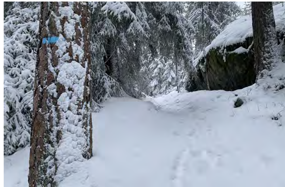
Den planlagte hogsten ved Larsbråten vil berøre et viktig nærskogområde med blåstier.

I 2023 ble det startet et arbeid med sikte på å få registrert nøkkelbiotoper i de områdene på kommunens eiendom i Østmarka som ikke er vernet. En nøkkelbiotop er et område som inneholder kvaliteter som er spesielt viktige for de sjeldne og truede artene. I dette arbeidet benytter kommunen skogbrukssektorens kartleggingsmetodikk Miljøregistrering i skog (MiS) for å registrere miljøverdiene. På grunnlag av resultatene av kartleggingen foretas en utvelgelse og avgrensning av nøkkelbiotoper. Arbeidet skal etter planen ferdigstilles i 2024. Vi regner det som selvsagt at de planlagte hogstene i Østmarka ikke blir gjennomført før registreringen er gjennomført. Og vi forventer videre at det generelt ikke blir hogd i områder med rødlistede arter.