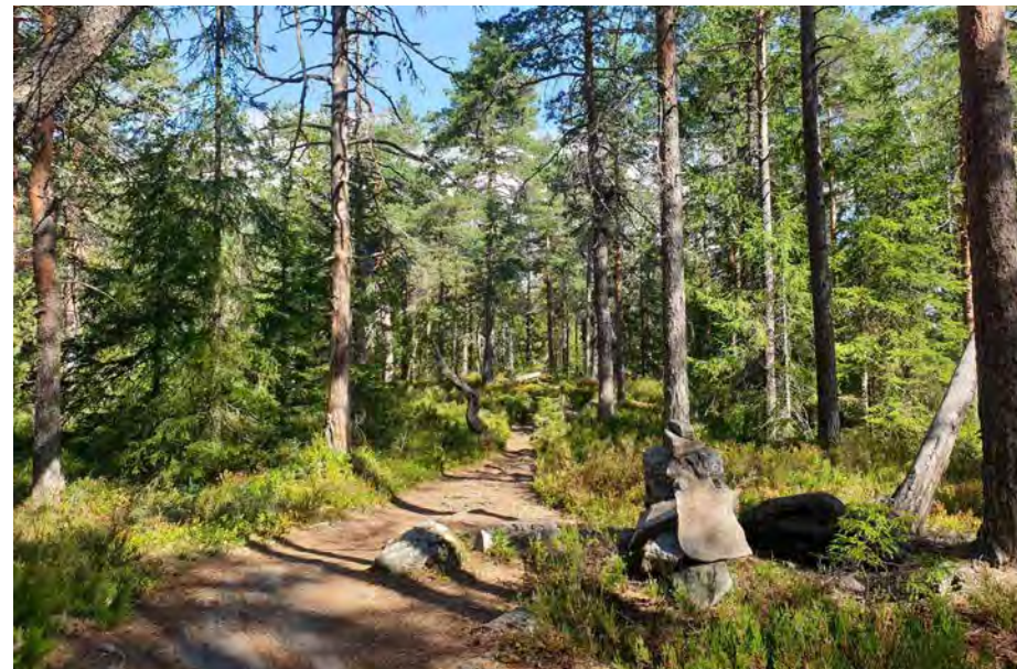
Puttåsen er tilbudt til frivillig vern. Blåstien gjennom området byr på variert skog og fine naturopplevelser.

Det var en aldri så liten sensasjon da vi i midten av mars ble informert om at Regionkontor landbruk for Lørenskog, Oslo og Rælingen (Landbrukskontoret) trakk sin tillatelse til hogst i seks bestand på Losby Bruks eiendom. Dette skjedde på bakgrunn av klager fra Naturvernforbundet i Oslo og Akershus (NOA) og ØV, der det blant annet ble påpekt at det er funnet rødlistearter i to av bestandene og at miljøregistreringene på eiendommen generelt var utdaterte. Landbrukskontoret