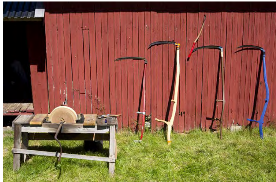
Fortsatt brukes ljaene flittig under ståtetreffet på Bøvelstad.

I 2003 foreslo ØV at husmannsplassen Sørli ved Nøklevann skulle bli besøksgård, og dette ble vedtatt av bystyret i Oslo i 2007. Vi har i mange år øvd påtrykk på både BYM og politikerne for at planene skulle bli realisert. I Behovsplanen for idrett og friluftsliv i 2016 prioriterte byrådet Sørli høyt og satte av 6 millioner på budsjettet for 2017. Populære parsellhager ble etablert våren 2017. Arbeidet med istandsetting av bolighuset ble ferdigstilt i 2018, og den gamle driftsbygningen i løpet av 2019. BYM fikk endelig midler til ansettelser i 2020, og besøksgården har nå en bestyrer og agronom.