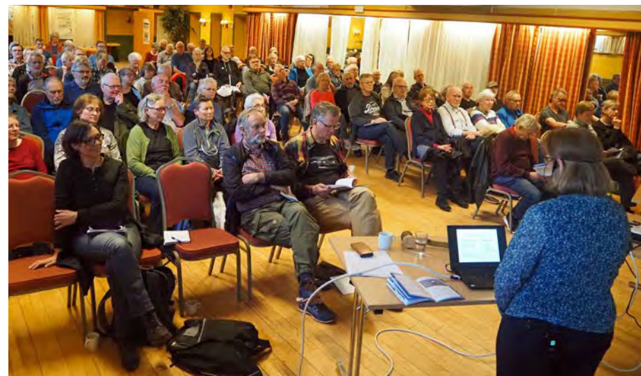
De ca. 90 fram møtte på ØVs årsmøte 20. april var svært godt fornøyd med styrets arbeid.

ØV gjennomførte syv vervedager i 2023: Ved Østmarksetra 13. mai, Bysetermåsan 11. juni, ved bommen til Sandbakken 11. juni, Østmarksetra 10. september, Rustadsaga 1. oktober, ved bommen til Sandbakken 15. oktober og Rustadsaga 28. oktober. I tillegg til vervestands har vi også i 2023 benyttet sosiale medier. Der har vi oppfordret de som følger oss og deler våre verdier og