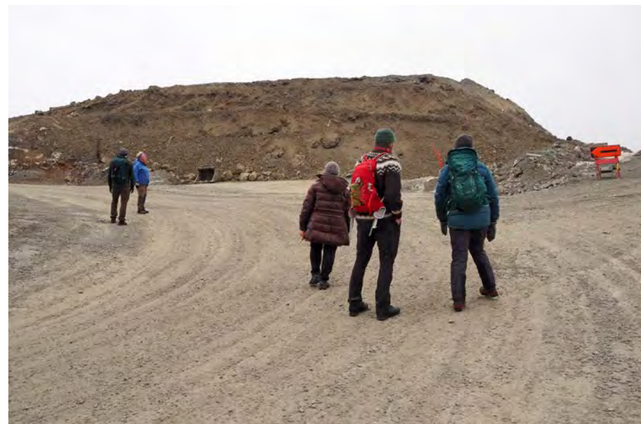
Marikollen er snart Østmarkas høyeste topp, og alle toer sine hender.

Området sett sørfra fremstår meget eksponert, og derfor ønsket ØV en mer skånsom utbygging som utnytter terrengvariasjonene, gir en variert boligbygging og sparer de få gjenværende trær. ØV mente at det er viktig at inngrepet i Hektneråsen ikke kommer i konflikt med viktige natur- og friluftslivsinteresser i området som ligger helt inntil markagrensa. Et godt utbygd stinett vestover inn i Østmarka samt den populære DNT-hytta Huldreheim og den nylig etablerte Østmarka nasjonalpark, gir store muligheter for utøvelsen av et allsidig friluftsliv i området.