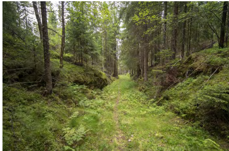
Her går en av Østmarkas ikoniske skiløyper i dag – snart erstattet av en massiv skogsbilvei?

Året begynte brutalt for skogutvalget i ØV; allerede 4. januar mottok vi melding om at Landbrukskontoret hadde godkjent elleve hogster fordelt på 16 bestand på Losby Bruks eiendom. NOA og ØV reagerte umiddelbart på tre av hogstene, som omfattet hele eller deler av åtte bestand i området begrenset av Røyrvannsveien, Skålsjøveien og Vestre Tonekollen. I fem av bestandene skulle det foretas småflate- og gjennomhogst på til sammen 56 dekar, og i de tre øvrige skulle det avvirktes 18 dekar ved flatehogst.