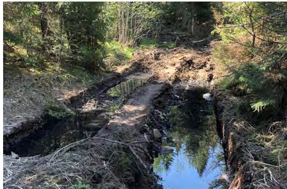
Store kjøreskader i Brudalen etter tømmertransport.

I hogstøknaden for ett av bestandene var det følgende merknad: «Granbestand med noe tørkestress. Egen søknad på hogst av kantsonen mot Åbborvannet». Ellers var det ingen kommentarer vedrørende hogst langs vannet, verken i hogstøknadene eller Landbrukskontorets svar, noe vi fant svært underlig.