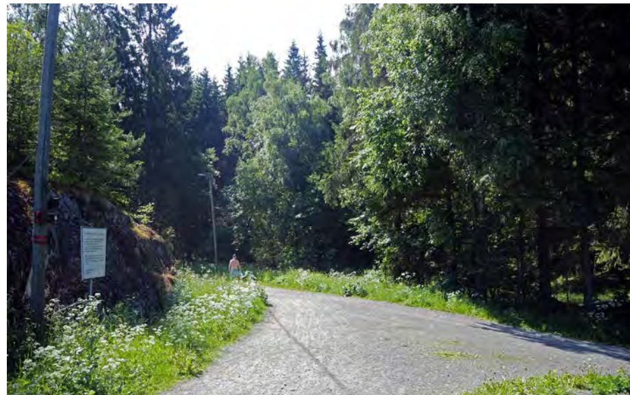
Et av bestandene som skulle hogges ligger vest for og nær inntil turveien fra Ekerud mot Lintjern, til høyre i bildet.