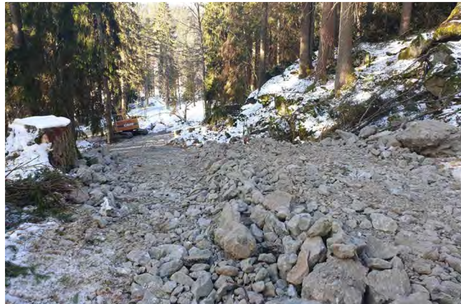
Slik så den ulovlige anleggsveien ut da ØV fikk varsel om den.