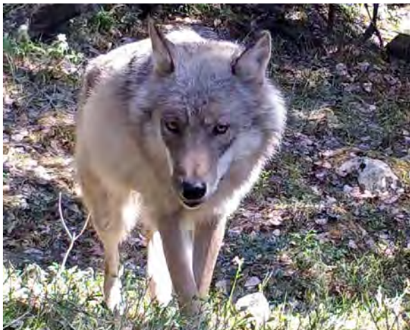
Ledertispa v572 er Skandinavias eldste ulv. Født i Østmarka våren 2015.