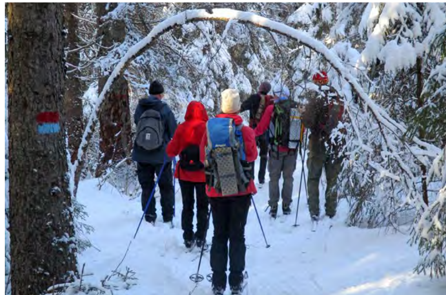
Magisk skitur langs Plankeveien i 2023.