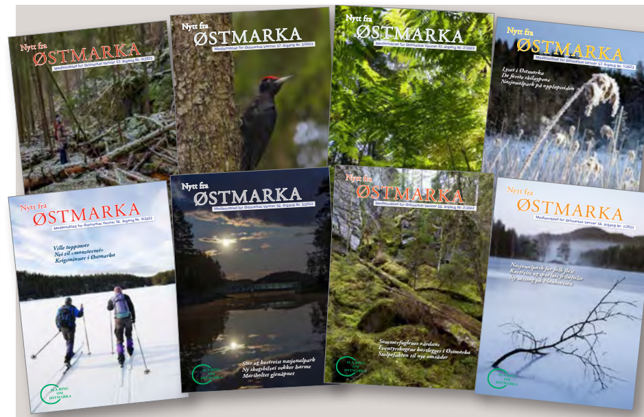
To årganger av medlemsbladet Nytt fra Østmarka .