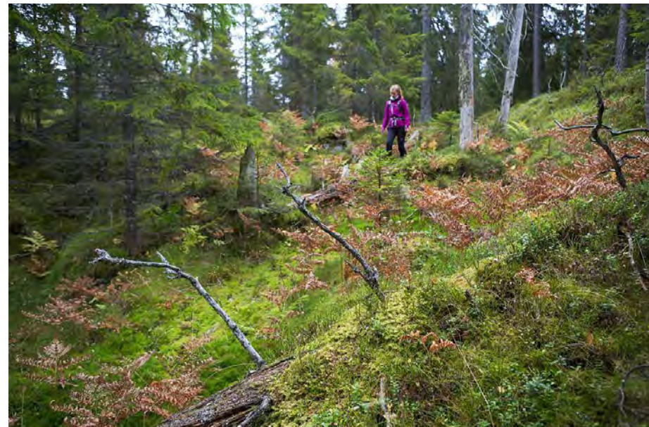
I Oslo kommunes arealplan omtales myr og gammelskog som spesielt verdifulle arealer.

ØV videresendte henvendelsen til Norges vassdrags- og energidirektorat (NVE) og opplyste samtidig at «Sølvdobla ligger ca. 0,5 km øst for Grønmo golfbane i Oslo kommune og ligger på